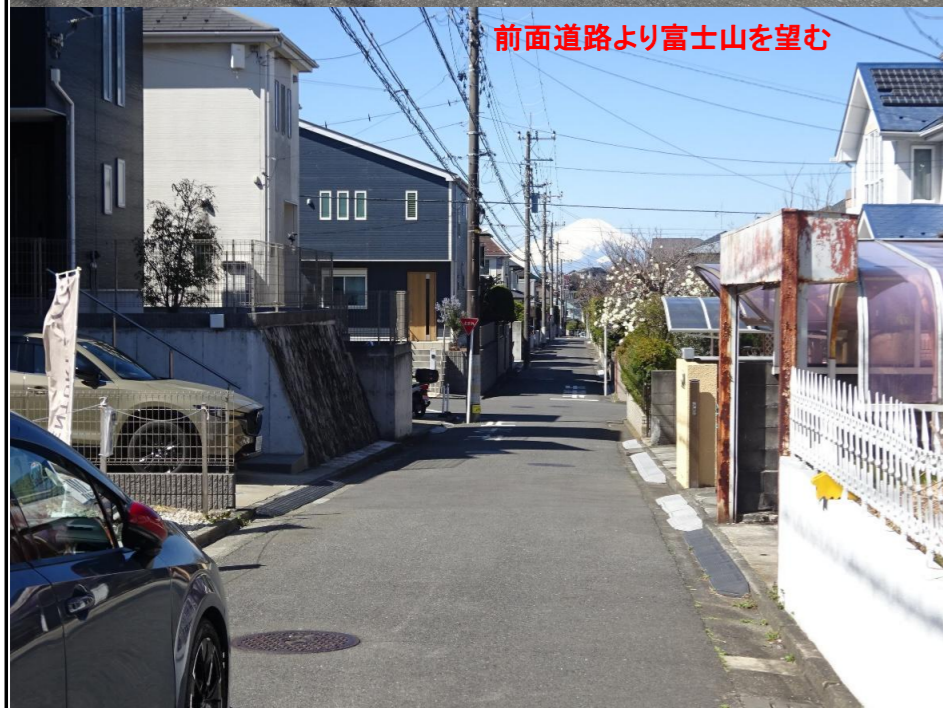
前面道路より富士山を望む